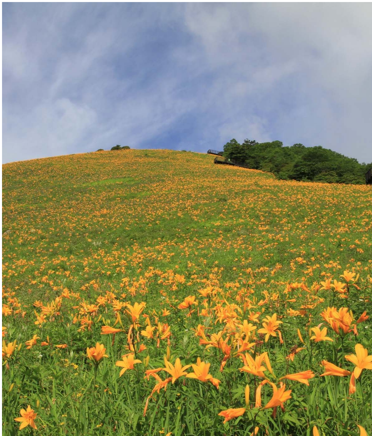
栃木県日光市のキスゲ平に群生するニッコウキスゲ