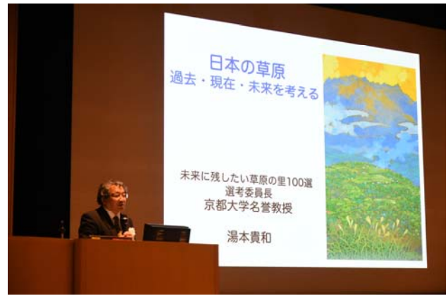
湯本選考委員長による講演

旧石器時代（約 25,000 年前）の寒冷な日本に広がっていた草原は、縄文時代（約 7,000 年前）以降、