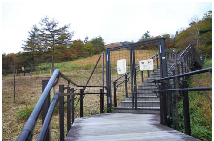
シカ侵入防止柵と入口ゲート