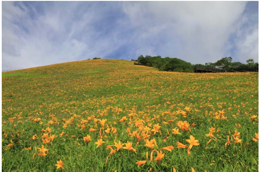
満開のニッコウキスゲ

キスゲ平は栃木県日光市に位置する日光連山の東端、標高1,300m～1,600mにかけて広がる草原です。4月のカタクリに始まり、夏のシモツケソウなど年間を通して150種類を超すたくさんの種類の花が春から秋まで楽しめます。その中でも6月中旬から7月にかけて咲くニッコウキスゲの群落は一見の価値があります。ニッコウキスゲの名前の由来は日光に多く自生していたことからこの名前と呼ばれるようになったと言われ、ここで言う日光とはキスゲ平周辺を指すものと考えられています。