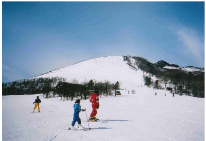
スキー場時代のキスゲ平

上記のような活動をおよそ 30 年継続してきたことで、激減したニッコウキスゲの数は徐々に回復し、近年では一面に咲くニッコウキスゲを見ることができるようになりました。しかしながら、最盛期の密度には遠く及ばないのが現状です。今の環境に満足せず、今後も継続的に活動を行っていけば、かつての風景を取り戻せると信じています。